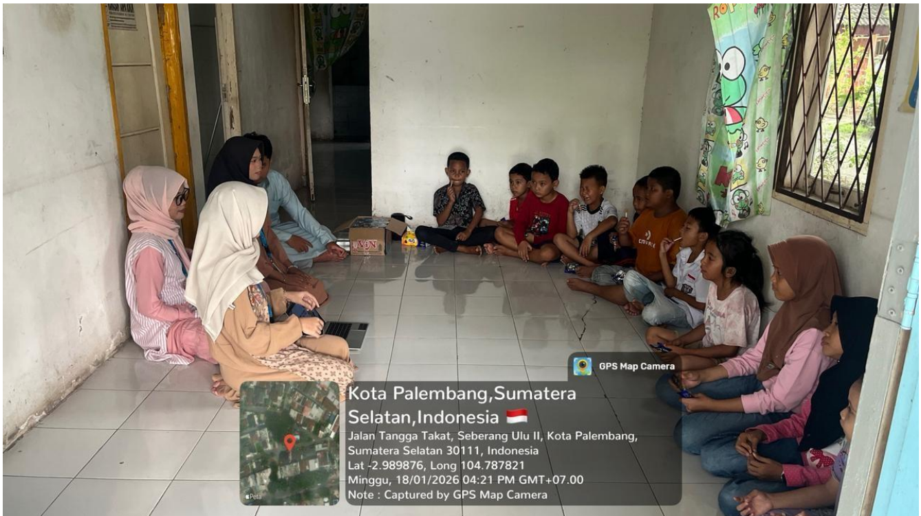
Gambar 3. Edukasi Literasi dan Keamanan Digital kepada Warga