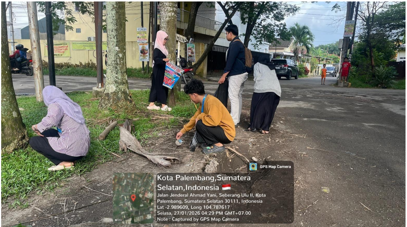
Gambar 5. Kegiatan Layanan Kebersihan Lingkungan di RT 17 Tangga Takat