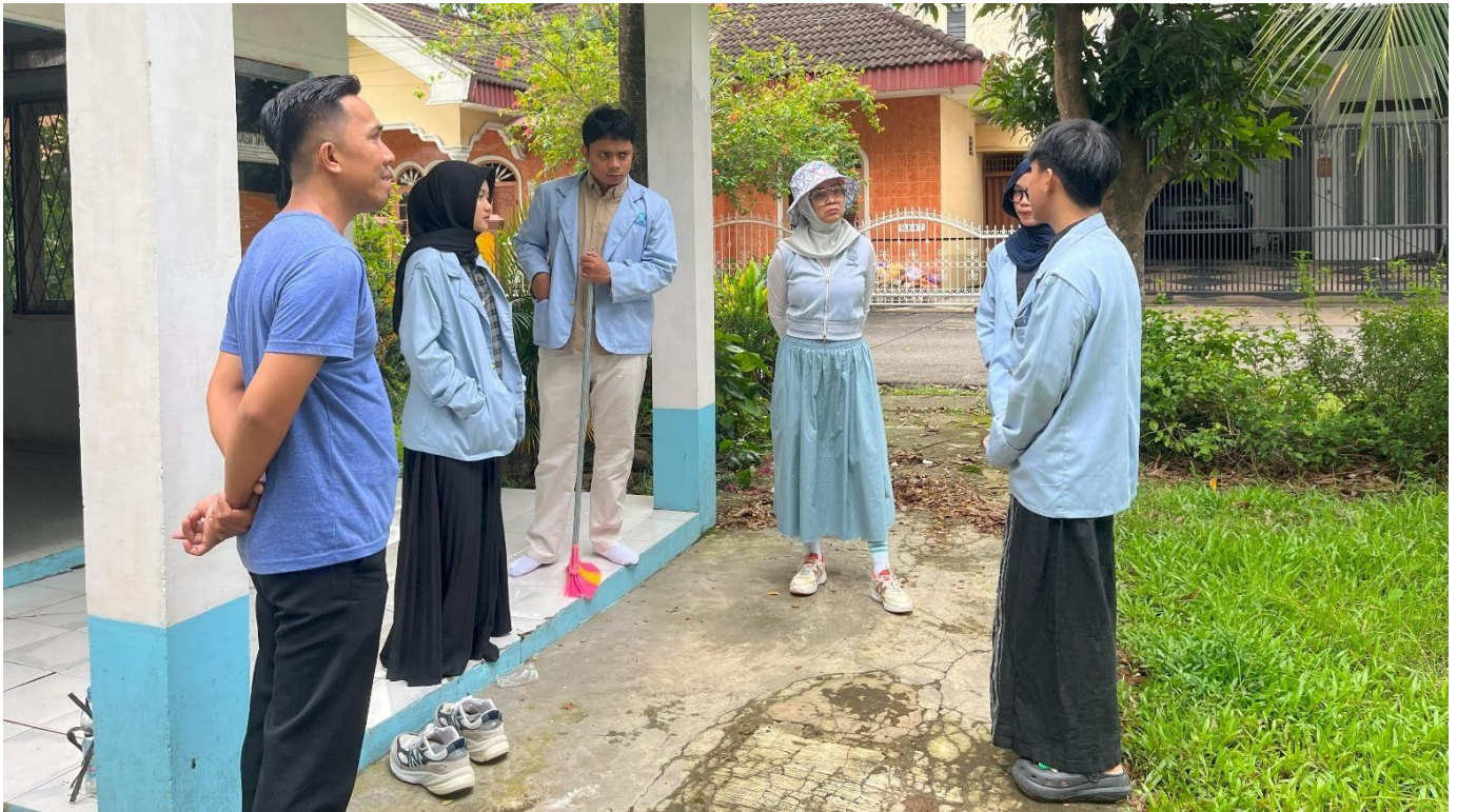
Gambar 2. Koordinasi dan Pengumpulan Data Administrasi RT bersama Ketua RT 17 Tangga Takat