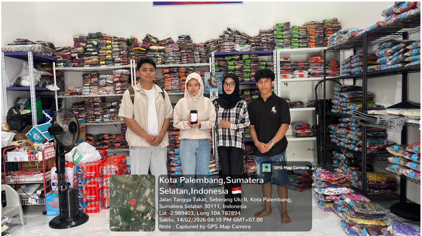
Gambar 4. Pendampingan Pembuatan QRIS bagi Pelaku Usaha Mikro di RT 17 Tangga Takat