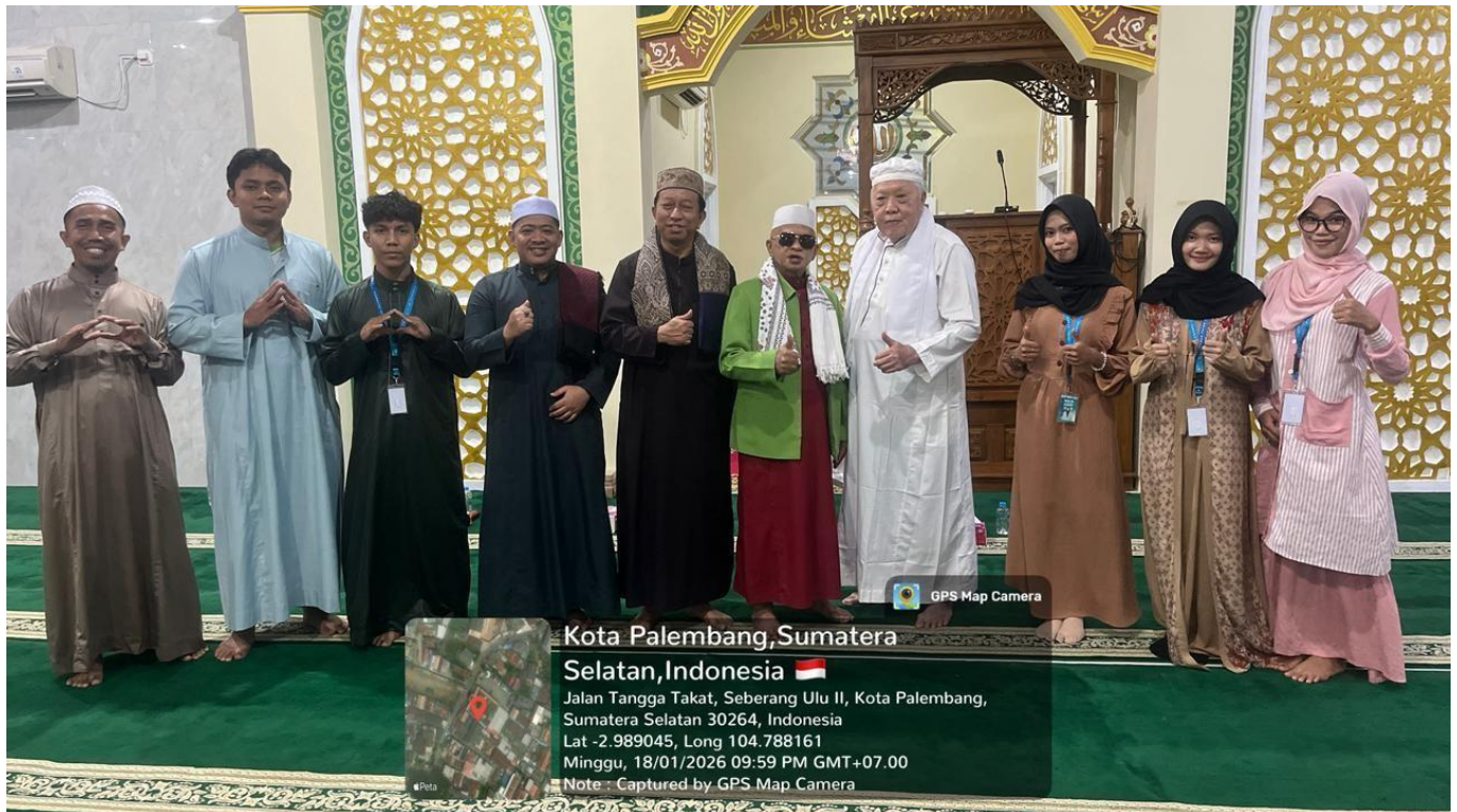
Gambar 6. Partisipasi Kegiatan Keagamaan di Masjid/Musholla Lingkungan RT 17 Tangga Takat